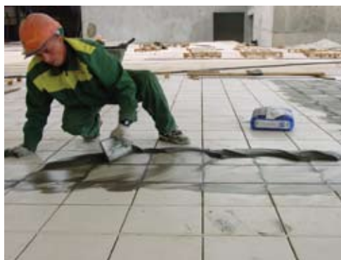
Использование LITOSCHROM 3-15 для затирки швов на полах из керамогранита в гипермаркете «Ашан» (Москва).

Дать раствору отстояться для дозревания в течение 3 минут и повторно интенсивно перемешать. Время использования раствора LITOSCHROM 3-15 при температуре окружающей среды +23°C приблизительно 2 часа.